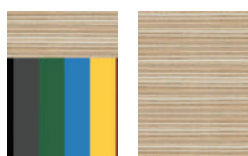
Topo de Parica + lam mel. color tx